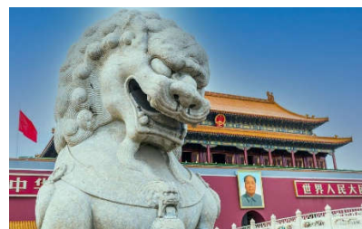
Pechino Mausoleo di Mao Tse-tung