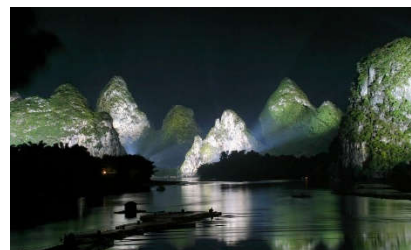
Yangshou Teatro sull'acqua