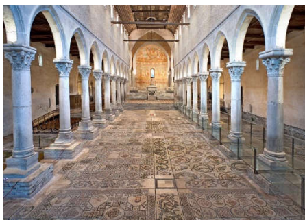
Aquileia - Basilica

In occasione della mostra evento a Villa Manin “ Confini da Gauguin a Hopper ”, andiamo alla scoperta del Friuli, regione poco conosciuta in cui storia, arte e gastronomia si intrecciano e creano un unicum, definito dal celebre scrittore friulano Ippolito Nievo “un piccolo compendio dell'universo”.