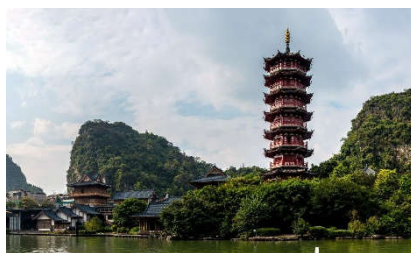
Guilin Vista fiume