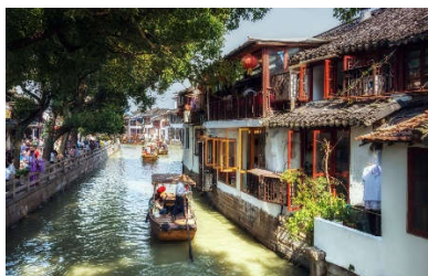
La città sull'acqua Zhuji

Un itinerario ricco di poesia, pensato per chi cerca la Cina dei paesaggi e delle emozioni. Dai tetti dorati di Pechino ai riflessi del fiume Li, fino alle cittadine sull'acqua e alle metropoli in fermento. Ogni tappa svela una Cina diversa: antica, spettacolare, romantica.