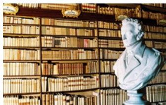
Recanati - Casa Leopardi

Tra i dolci saliscendi costellati di borghi, castelli, piccoli centri che custodiscono storie e tradizioni di un'Italia fuori dalle rotte del turismo di massa, lasciamoci stupire da Macerata, città di musica con il suo Sferisterio e dal suo territorio, in un caleidoscopio di bellezza e autenticità.