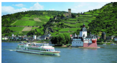
Crociera sul Reno

Il viaggio infatti ci offre la straordinaria possibilità di assistere, alla Kölner Philharmonie, al Götterdämmerung (Il Crepuscolo degli Dei) non soltanto ultimo atto della tetralogia wagneriana ma anche ultima tappa di una preziosa ricerca avviata da anni dal Maestro Kent Nagano sull'esecuzione filologica delle opere di Wagner.